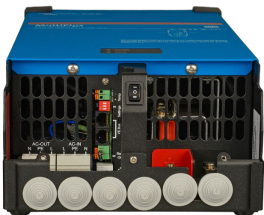
MultiPlus 2000 VA (alt kapak çıkarılmış)