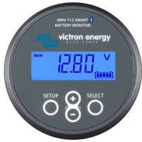
Bluetooth tespiti BMV-712 Smart Akü Monitörü