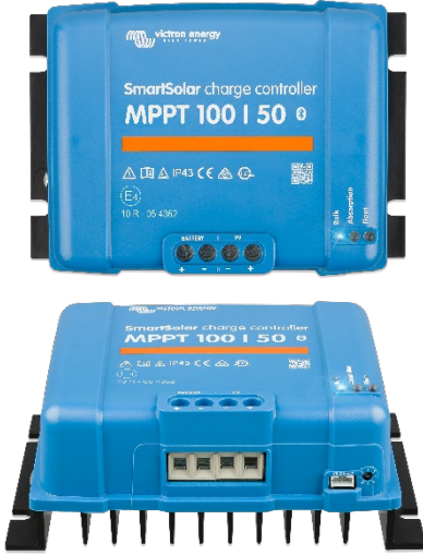
SmartSolar Şarj Kontrol Birimi MPPT 100/50

Entegre bağlantı kesme fonksiyonuyla tam boşalmış bir Li-ion aküye yeniden bağlanır.