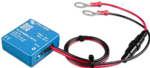
Bluetooth tespiti: Akıllı Akü Hassasiyeti