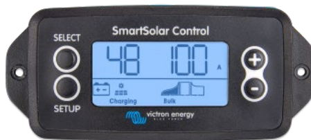
SmartSolar takılabilir ekran

Kontrol biriminin önündeki kapağı koruyan kauçuk mührü çıkarın ve ekranı takın.