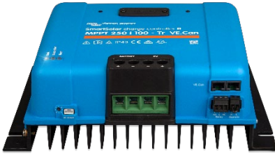
SmartSolar Şarj Kontrol Birimi MPPT 250/100-Tr VE.Can ekransız