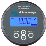
Bluetooth tespiti: BMV-712 Smart Akü Monitörü