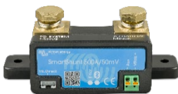
Bluetooth tespiti: SmartShunt