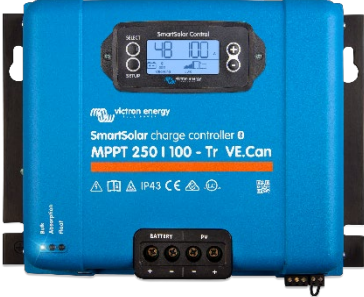
SmartSolar Şarj Kontrol Birimi MPPT 250/100-Tr VE.Can isteğe bağlı takılabilen ekranla