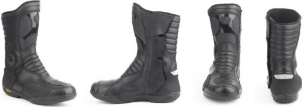
YDS DIABLO 11.0 GTX