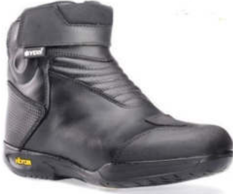
DIABLO 7.2 GTX