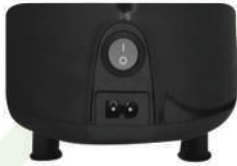
Açma Kapama Düğmesi