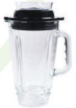
1,250 ml. Vakum Kapaklı Cam Sürahi