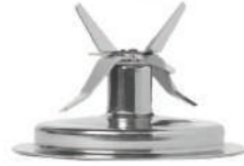
Paslanmaz Çelik Tertibatı