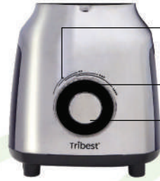
LED Güç Gösterisi