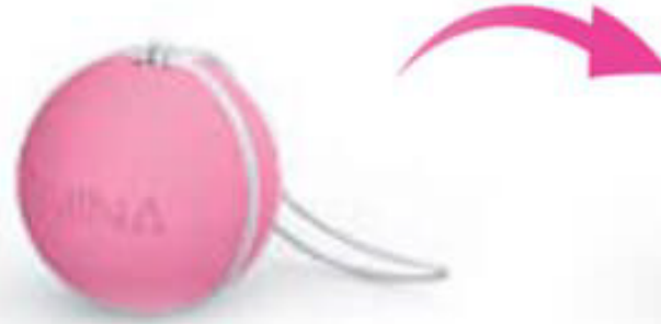
38 g Orta Direnç