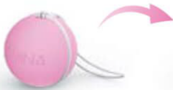
28 g Hafif Direnç

Pelvis tabanı egzersizlerini nasıl yapacağınız, antrenmanı kişiselleştirmeniz, daha yüksek ağırlığa geçmeniz ve size uygun antrenman ritmini bulmanız için adım adım yol gösteren Laselle™ Egzersiz Kılavuzunun tamamını indirmek için lütfen www.sagligadestek.com adresini ziyaret edin.