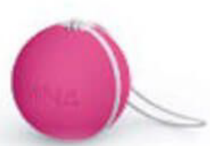
48 g Yüksek Direnç