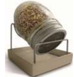
GEO FİLİZLENDİRME KAVANOZU