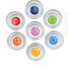
MYTHOS Çakra Olumlama Bardakları