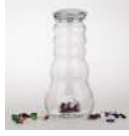
CADUS SU CANLANDIRICI KARAF 1.5 Lt