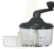
LURCH DOĞRAYICI MIXER MÜSLİ