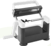
LURCH SPİRAL SEBZE DOĞRAYICI