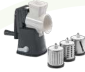
LURCH YAPRAK SEBZE DOĞRAYICISI CATTO