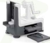
LURCH KOLLU TAMBUR RENDE