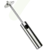
LURCH SEBZE/ MEVE OYACAĞI