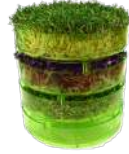
GEO FİLİZLENDİRME RAFLARI