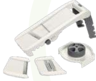
LURCH VARIO MANDOLİN