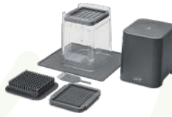
LURCH KUBUS DOĞRAYICI