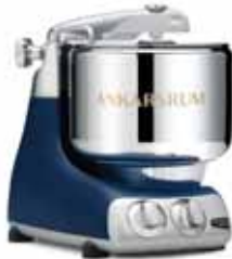
AKM 6230 RB Royal Mavi