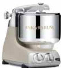
AKM 6230 HB Harmoni Bej