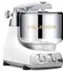
AKM 6230 GW Parlak Beyaz