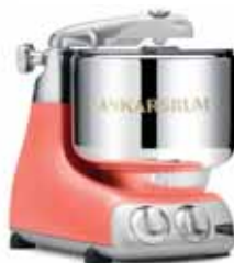
AKM 6230 CC Mercan