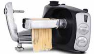
HAMUR KESİCİ Tagliate / Spagetti