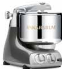
AKM 6230 BC Krom