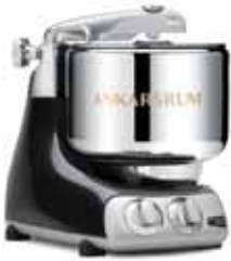
AKM 6230 BD Siyah Elmas

Bu ödül yaşam tarzı ve teknoloji dallarında dünyanın en büyük yenilikçilik ödülüdür. Bu ödül ile ürün kalitesindeki kusursuzluk belgelendirilir.