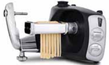
HAMUR KESİCİ Fettuccine