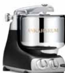
AKM 6230 B Siyah