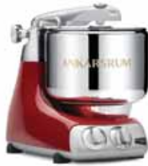
AKM 6230 R Kırmızı