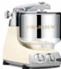
AKM 6230 LC Açık Krem