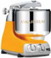
AKM 6230 SB Gün Işığı