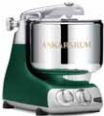
AKM 6230 FG Orman Yeşili