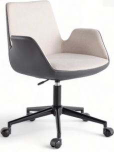
Sofia Serisi Krem Antrasit