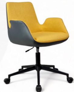
Sofia Serisi Sarı Antrasit