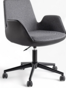
Sofia Serisi Siyah Antrasit