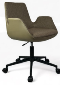
Sofia Serisi Kahve Bej