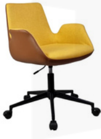
Sofia Serisi Sarı Taba