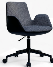
Felix Serisi Yeni Antrasit