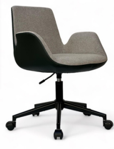
Felix Serisi Yeşil Krem