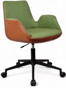
Sofia Serisi Yeşil Taba