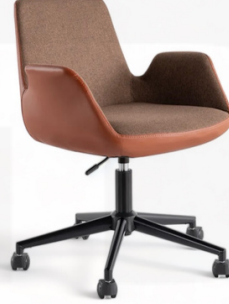
Sofia Serisi Kahve Taba