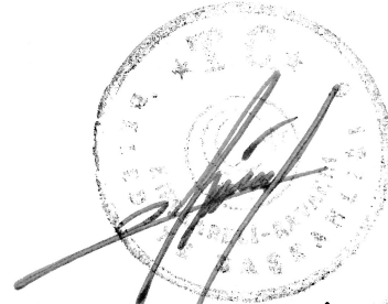
Gürel KOŞDEMİR Belediye Başkanı

14/7/2005 tarihli ve 2005/9207 sayılı Bakanlar Kurulu Kararı ile yürürlüğe konulan İşyeri Açma ve Çalışma Ruhsatlarına İlişkin Yönetmelik kapsamında düzenlenmiştir. A.ÇBN