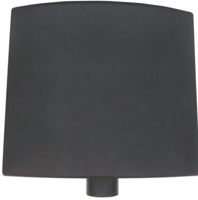
ANT382 9 dBi UHF Circular RFID Anten - Siyah