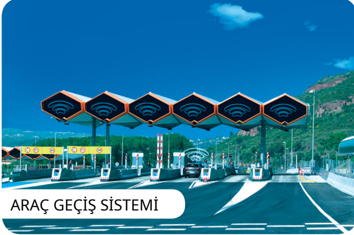
ARAÇ GEÇİŞ SİSTEMİ