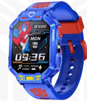
TF01 Akıllı Saat Kullanım Kılavuzu