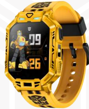
TF01B Akıllı Saat Kullanım Kılavuzu