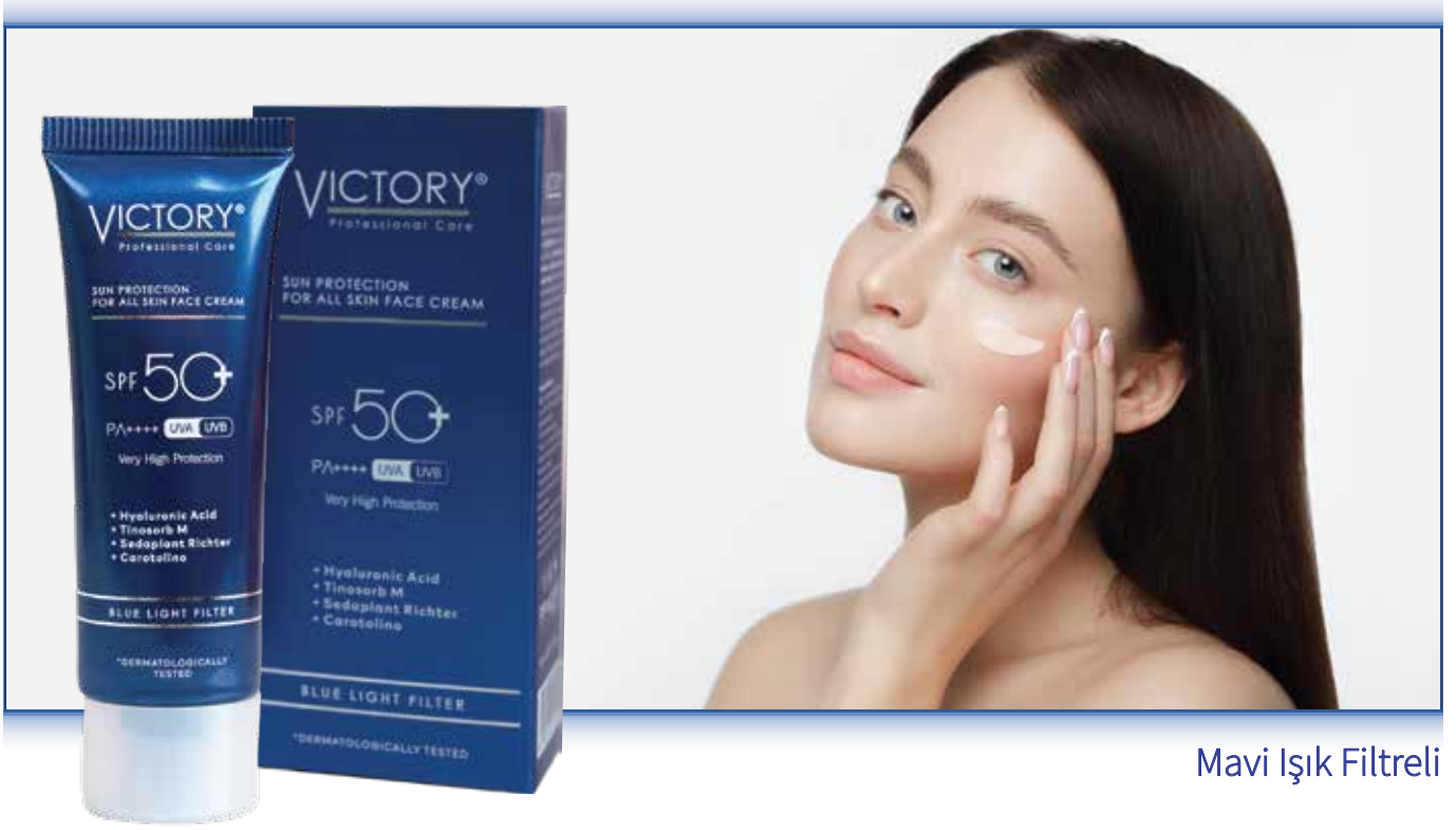
Mavi Işık Filtreli