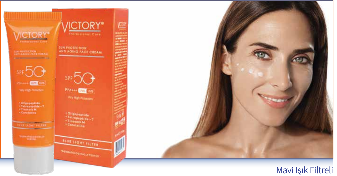
Mavi Işık Filtreli