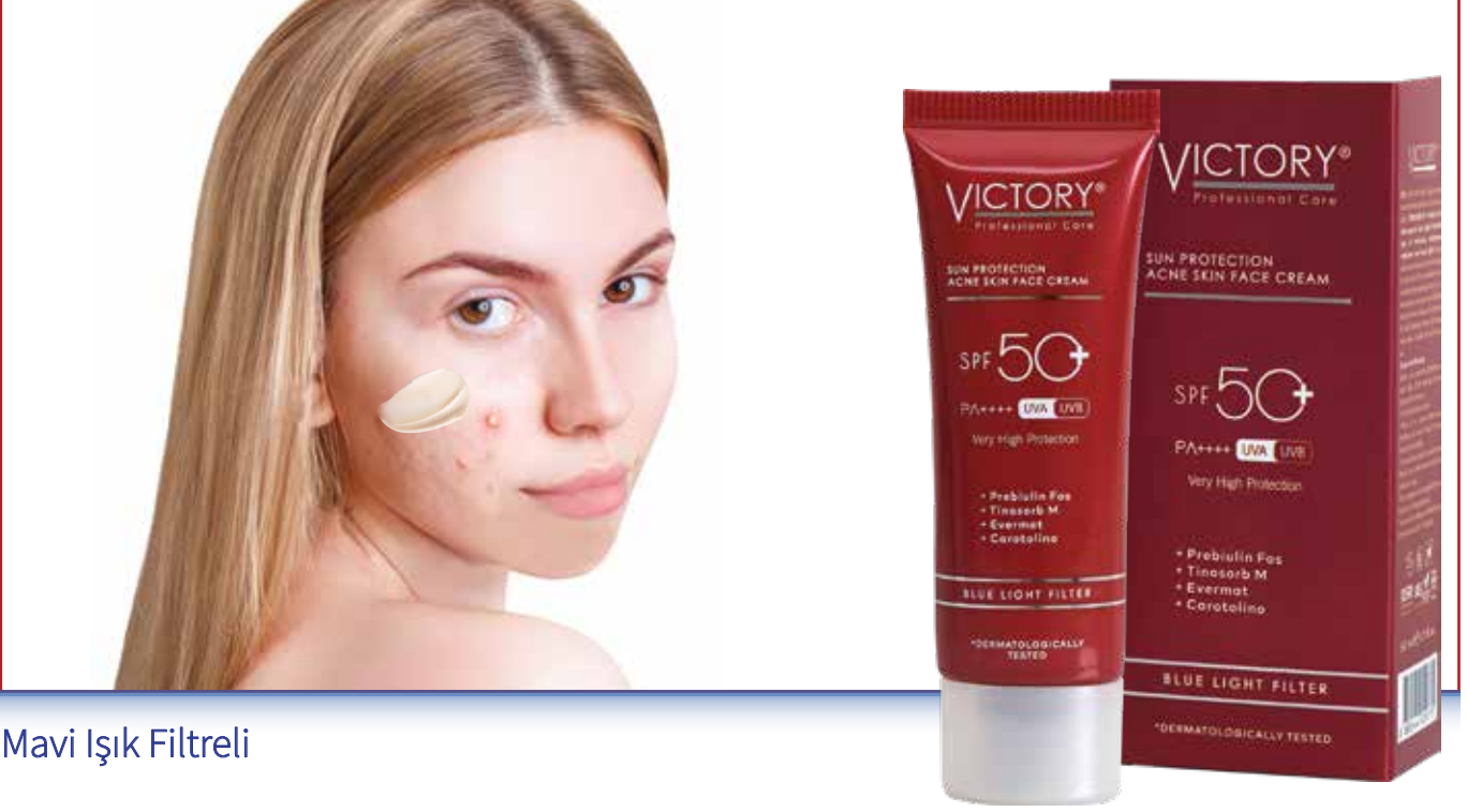
Mavi Işık Filtreli