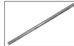
Su Seviye Göstergesi

ARIZA DURUMUNDA CİHAZINIZI KENDİNİZ TAMİR ETMEYE KALKMAYINIZ. İÇİNİ AÇMAYINIZ. MUTLAKA YETKİLİ SERVİSE MÜRACAAT EDİNİZ.