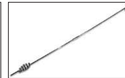
Süper Mini Anten Yayı