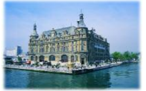
Haydarpaşa İstasyonu (1998)