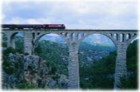
Varda Köprüsü'nün bugünkü görünüşü.