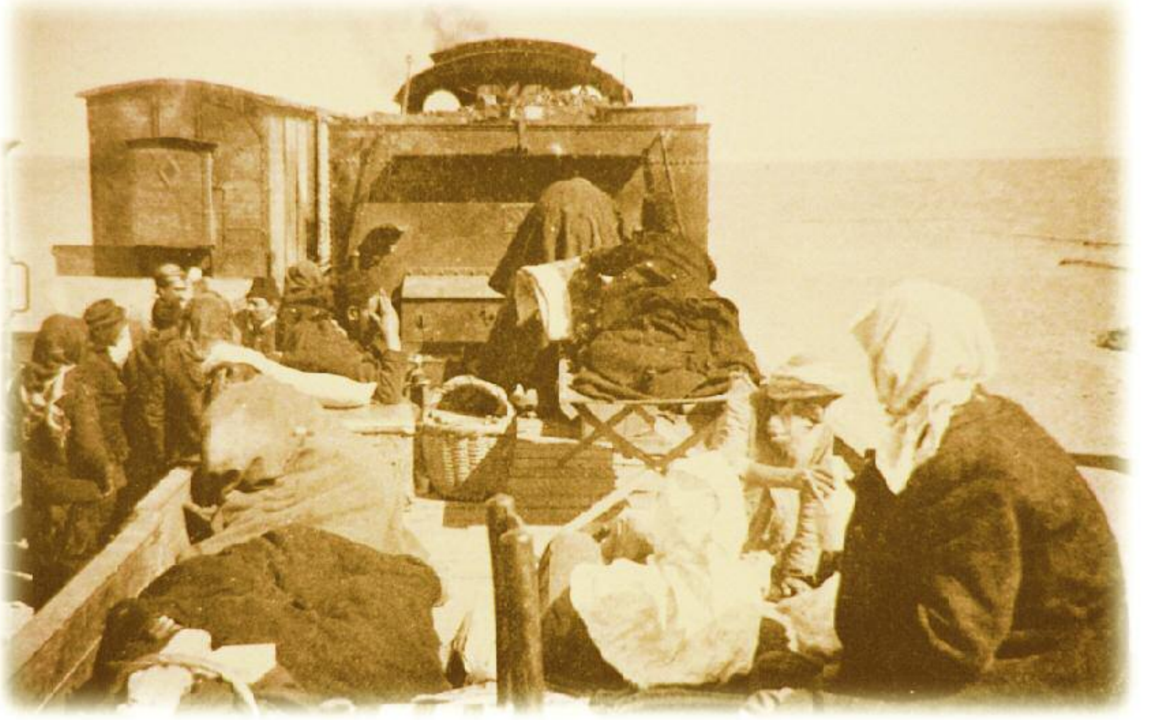
Hicaz Demiryolu'nun ilk Hacc yolcuları. (1909)