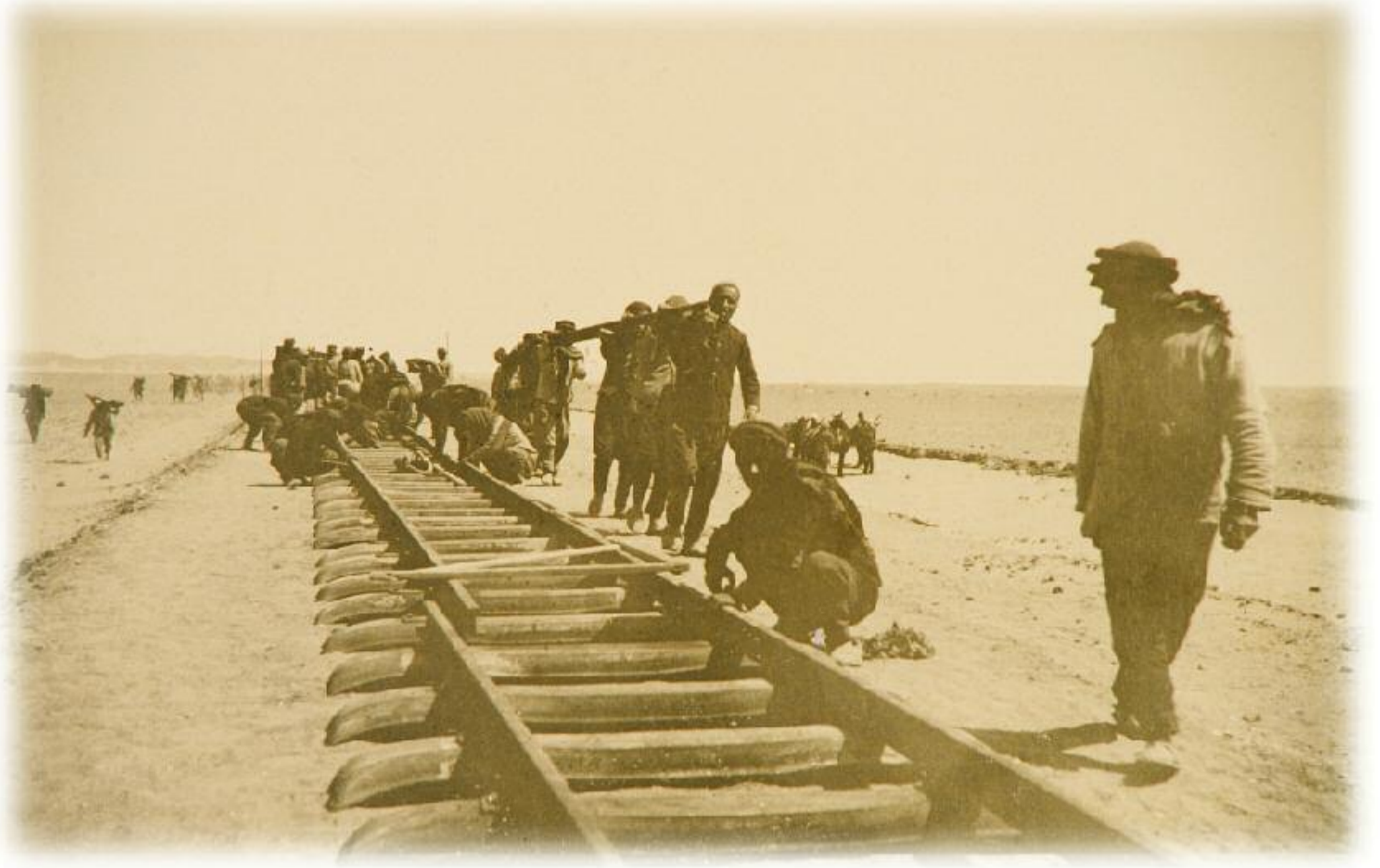
Hicaz Demiryolu'nun Ürdün ayağında sürdürülen demiryolu yapım çalışmaları. (1906)