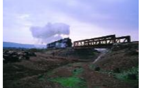
Der'a ile Bosra İstasyonları arasında bulunan köprülerden buharlı trenin geçişi.