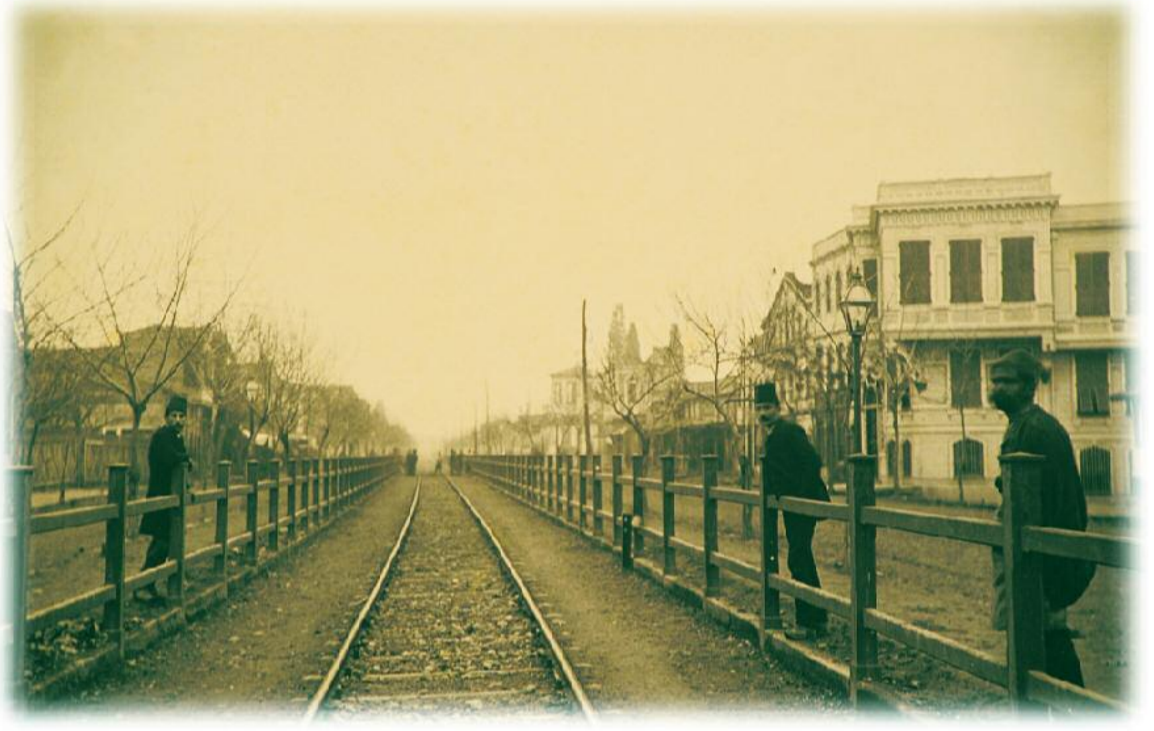
İzmit'in bugünkü adıyla "Demiryolu Caddesi"nin 1873'deki görünüşü.