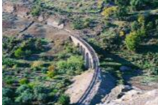
Yarmuk Vadisi'nde bulunan taş köprülerden biri.