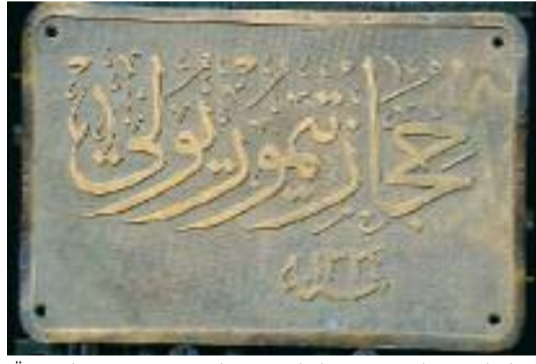
Üzerinde "Hicaz Demiryolu" yazısı bulunan orijinal pirinç levha.