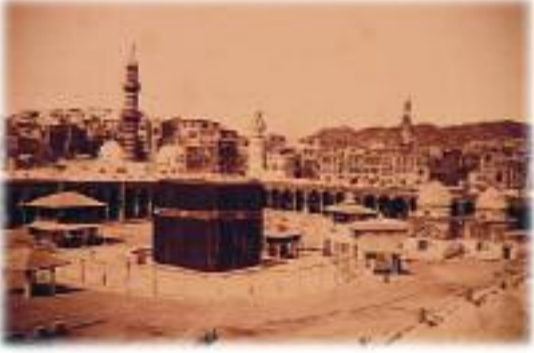
Kabe'nin 1909 yılındaki görünümü.