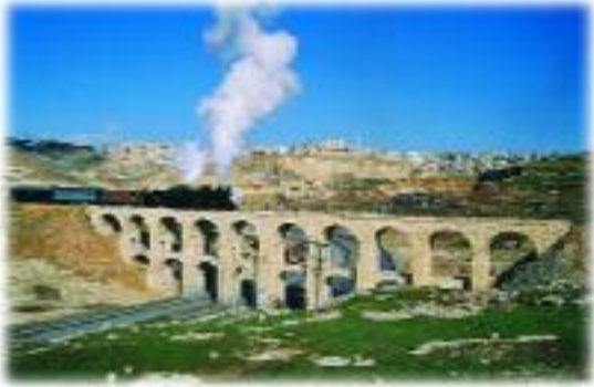
Ürdün Cesim Köprüsü'nün 1998'deki görünüşü.