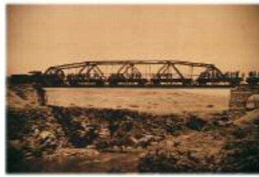
Hayfa bölgesinde yarmuk nehri üzerindeki 1. demir köprü.