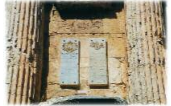
Hicaz Demiryolu yapımı anısına II. Abdülhamit ile Alman İmparatoru II. Wilhelm arasında yapılan dostluk anlaşmasının Lübnan Baalbek barabelerindeki yazıtları. (10 Kasım 1898)