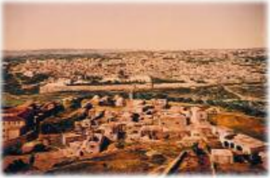
Kudüs şehrinin Zeytin Dağı'ndan görünüşü. (1901)