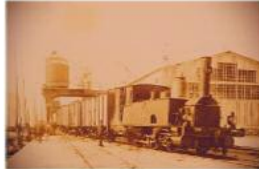
Haydarpaşa İstasyonu'nda zahire depolan.