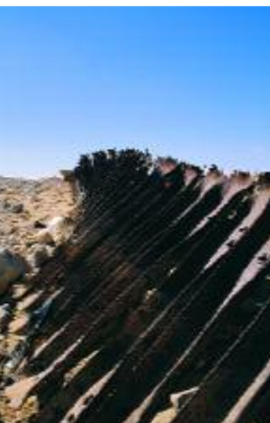
Tahrip edilmiş raylardan bir kesit.