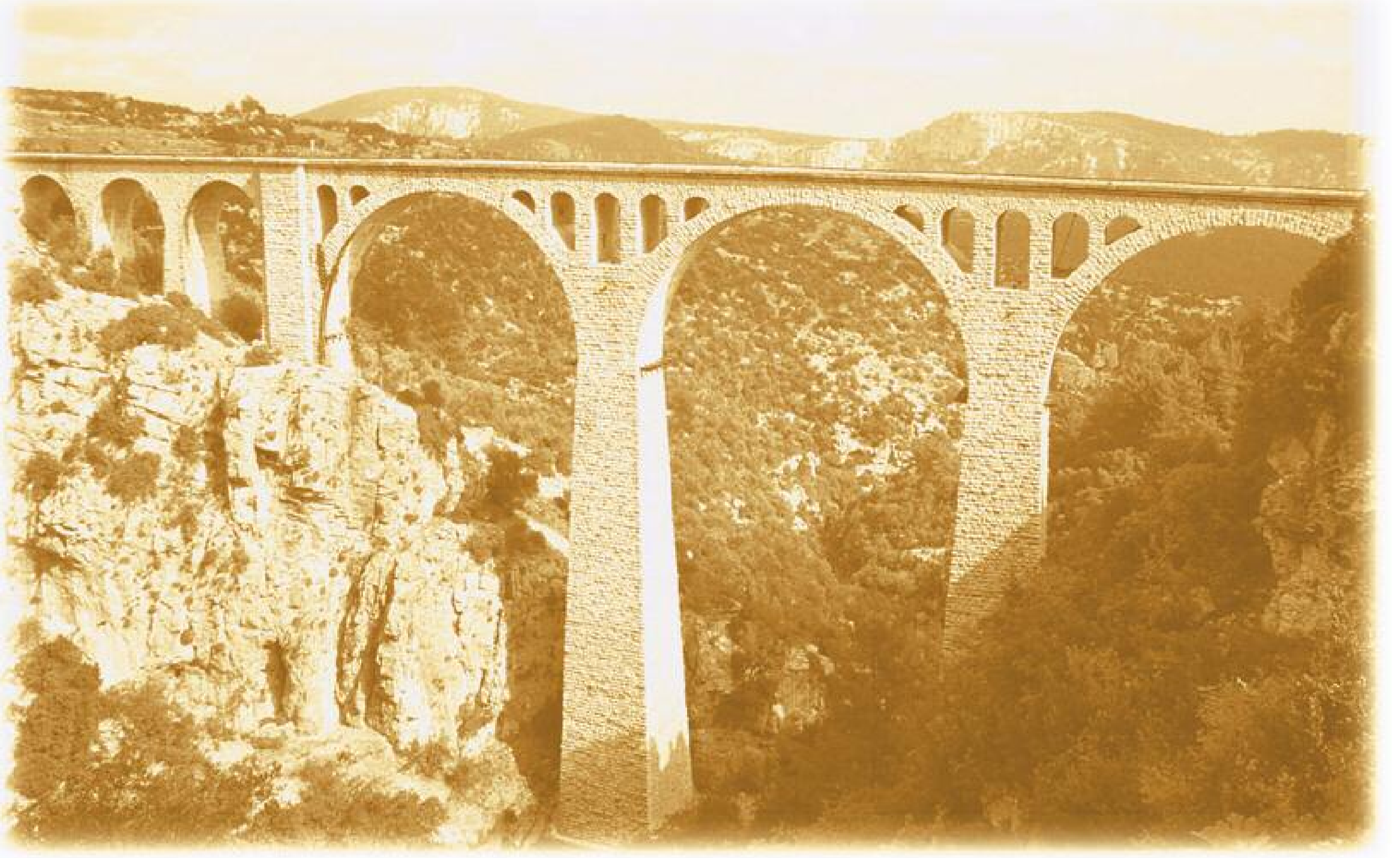
Toroslar üzerinde 110 m yükseklikteki Varda demiryolu köprüsü.