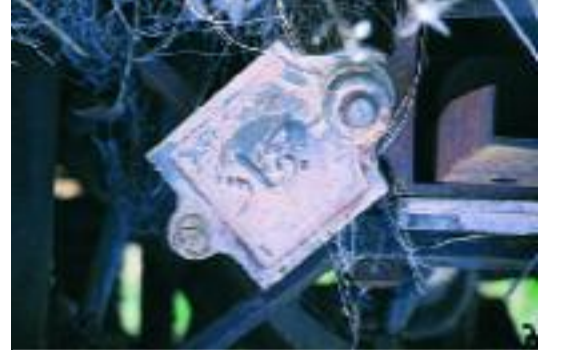
Eski bir trenin tekerleğinde bulunan ve üzerinde Hicaz yazan bir levha.