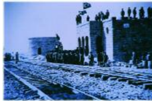
Suudi Arabistan El-Muadhem istasyonu açılışı.