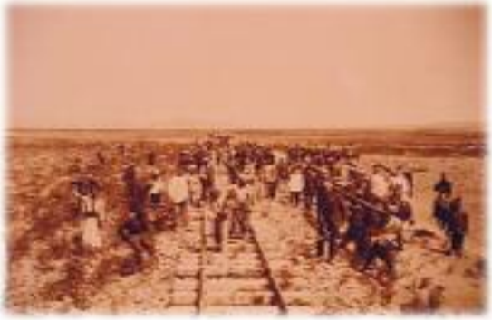
Suriye-Kisve bölgesindeki demiryolu çalışmalarından bir görüntü. (1901)