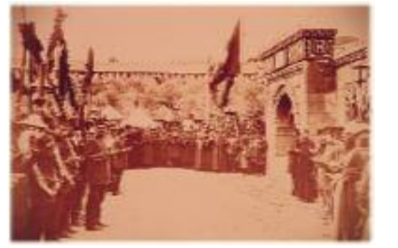
Kudüs Şimendifer Cad. üzerindeki çeşmeye lokomotifler için ilk suyun verilmesi dolayısıyla yapılan açılış töreni.