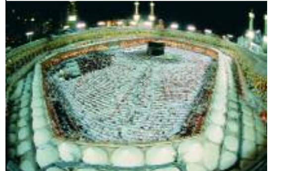
Mekke-i Mükerreme ve Kabe'de tavaf.