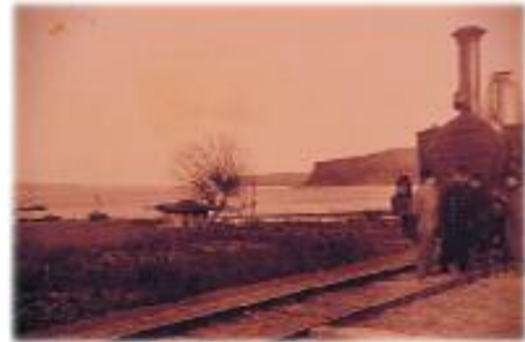
Sapanca Gölü'nün kenarında uzanan demiryolu.