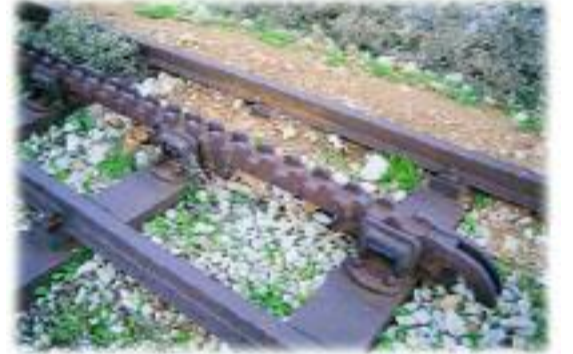
Zamanın teknolojisini yansıtan ve eğimli bölgelerde frenleme amacıyla kullanılan dişli raylar.