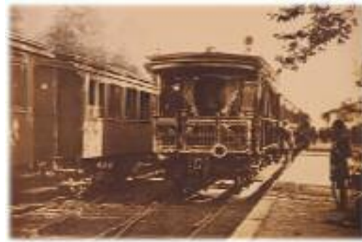
II. Wilhelm ve eşinin demiryoluyla Hırc'e gidiş anı.