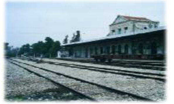
Kudüs Gari'nin bugünkü görünümü. (1998)