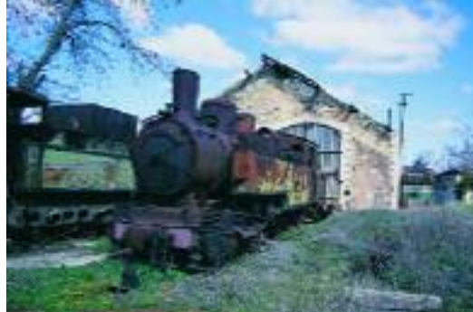
Rayak İstasyonu'nda tren mezarlığı.