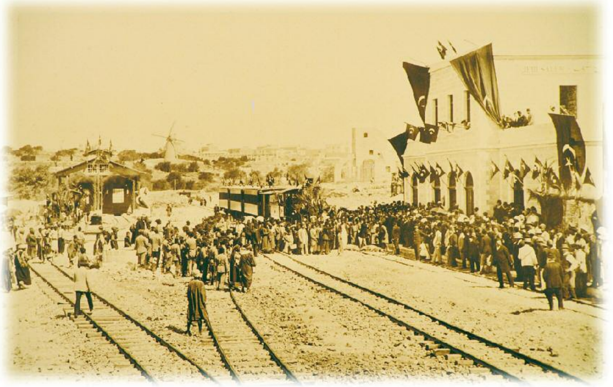
Hicaz Demiryolu'nun bağlantı güzergahında bulunan Kudüs Gari'nin açılış töreni. (Eylül 1891)