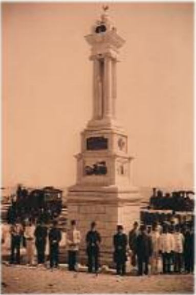
Hicaz Demiryolu bağlantısı üzerindeki Hayfa İstasyonu'nda inşa edilen abide.