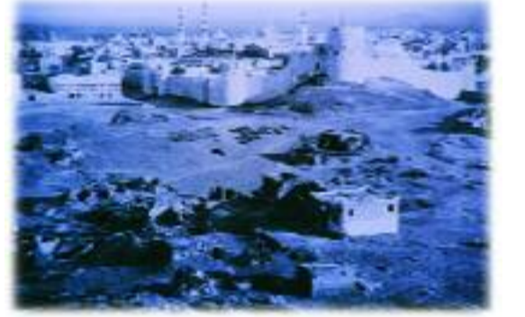
Medine-i Münevvere'nin 1909 yılındaki genel görünüşü.