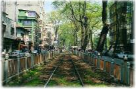
Bugünkü haliyle İzmit Demiryolu Caddesi. (1998)