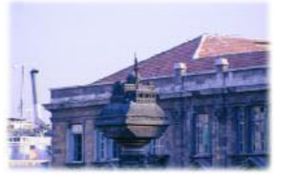
Şam'ın merkezinde Hicaz Demiryolu anısına yapılan telgraf direği anıtının tepesinde yer alan Yıldız Camii'nin maketi.