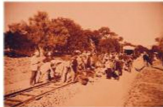
Şam'da Hicaz Demiryolu yapım çalışmaları.