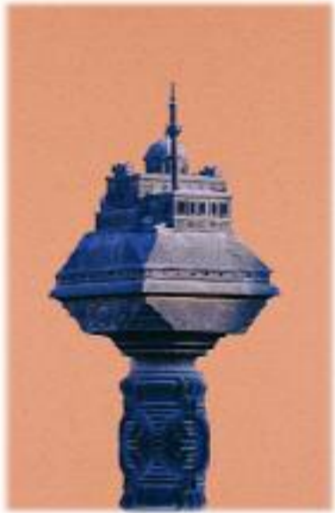
Şam telgraf direğinin tepesindeki Yıldız Camisinin maketi.

Hicaz Demiryolu, kısa ömrüne rağmen önemli askerî, siyasî, dinî, ekonomik ve sosyal sonuçların doğmasına neden olmuş ve tarihin unutulmaz sayfalarında yerini almıştır.