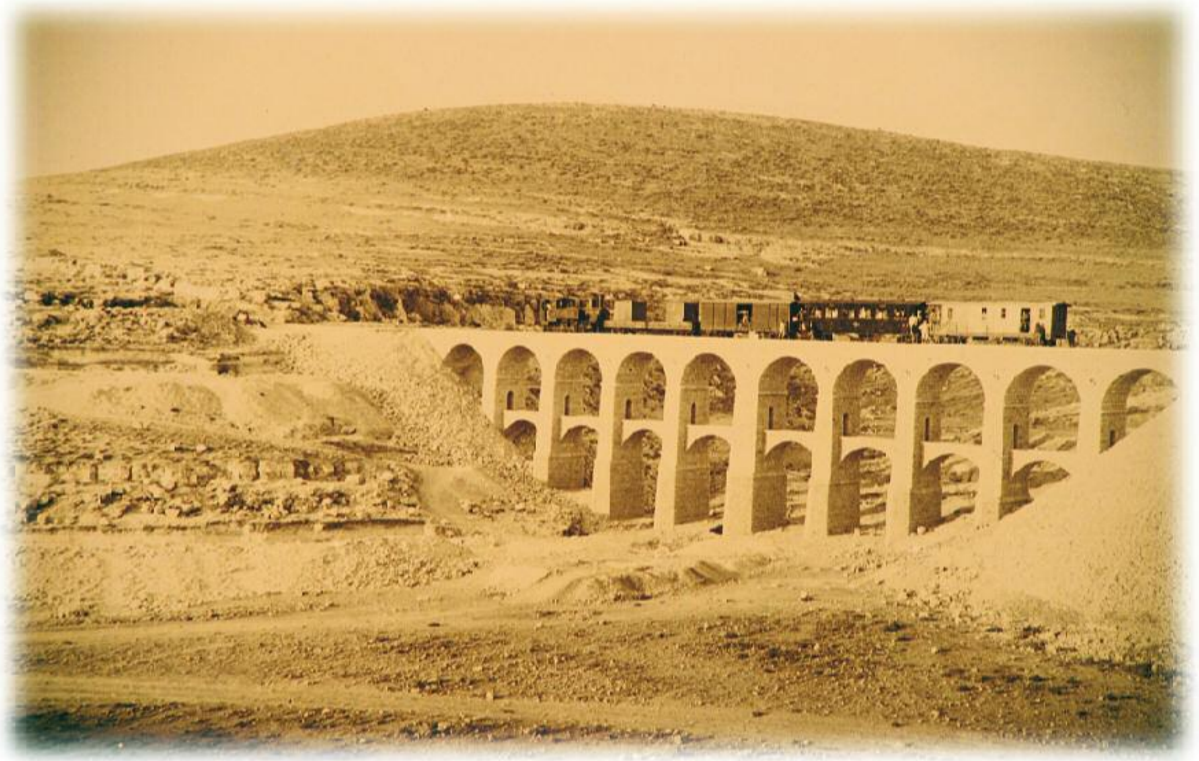
Hicaz Demiryolu güzergahındaki en güzel köprülerden biri olan Ürdün'deki Cesim Köprüsü'nün 1904 yılındaki görünüşü.