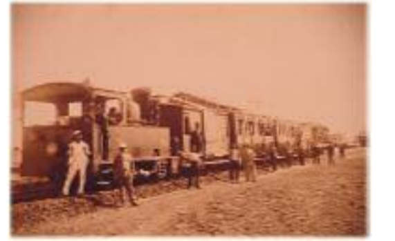
Suriye-Muzayrib'e inşaat malzemesi taşıyan katar.