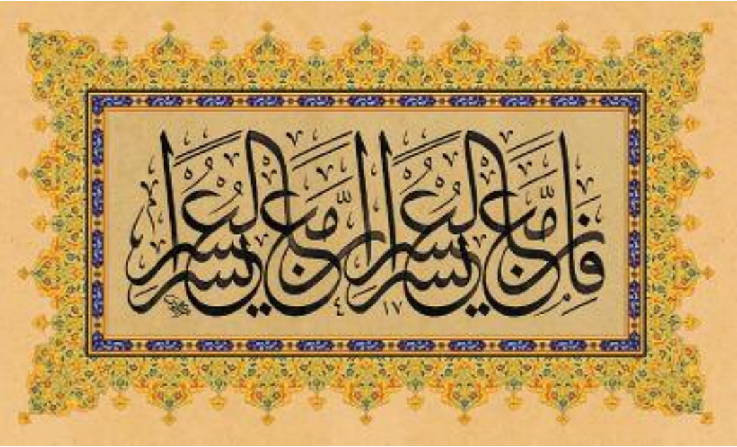
Private collection (Abdurrahman Al-Owais) - Dubai