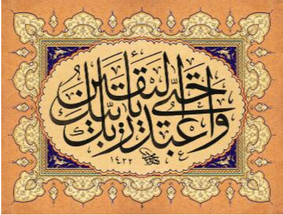
Calligraphy: Mehmed Özçay, Illumination: Fatma Özçay