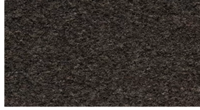
82 BLACK GREY