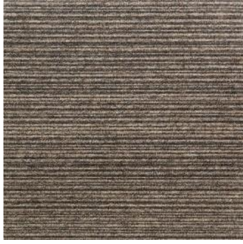
AVANT STRIPE 193