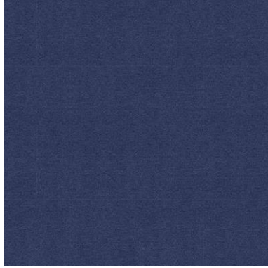
GRAVITY PARKING 17