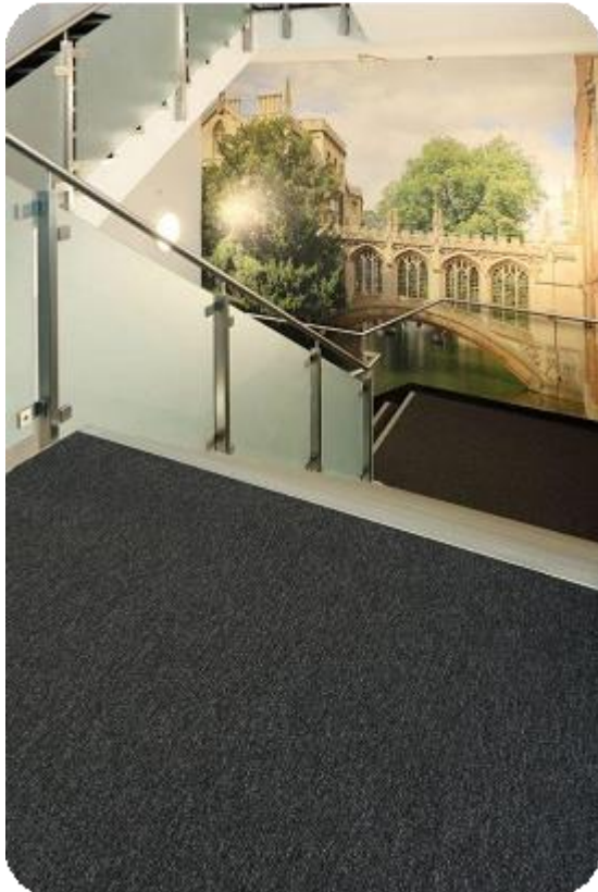
ARTLİNES PASPAS SİSTEMLERİ