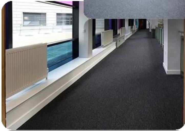
ARTLİNES KARO HALI