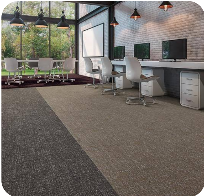
ARTLINES PASPAS SİSTEMLERİ