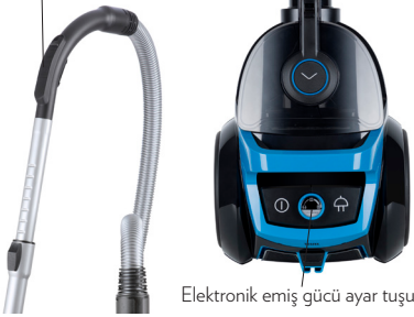
Elektronik emiş gücü ayar tuşu