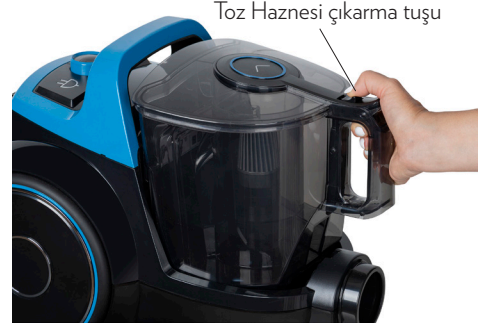
Toz Haznesi çıkarma tuşu