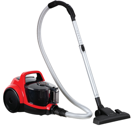
Toz Haznesi çıkarma tuşu