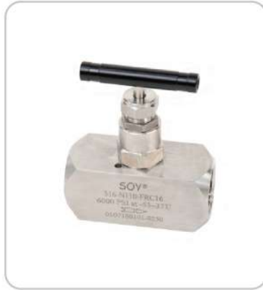
İğneli Vanalar Needle Valves