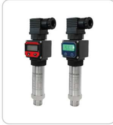
Basınç Transmitterleri Pressure Transmitters