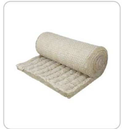
Taş Yünü Rock Wool