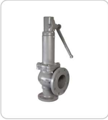
Emniyet Ventilleri Safety Valves