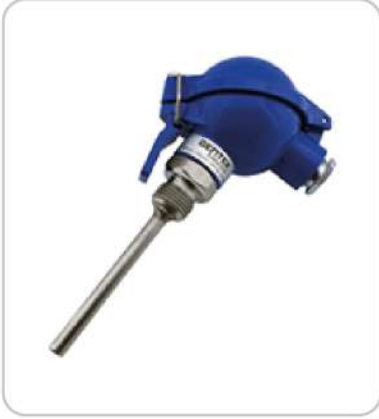
Sıcaklık Transmitterleri Temperature Transmitters