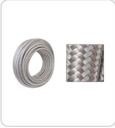
Örgülü Hortumlar Braided Metal Hoses