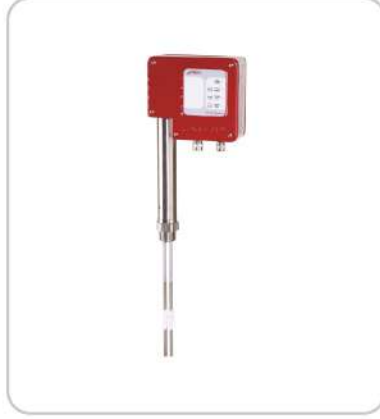
Kazan Tipi Seviye Elektrodu On/Off Boiler Type Level Electrode On/Off