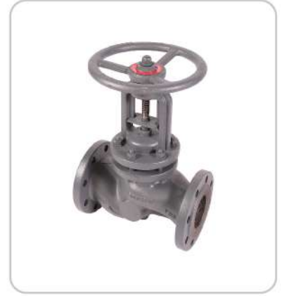
Pistonlu Glop Vanalar Piston Globe Valves