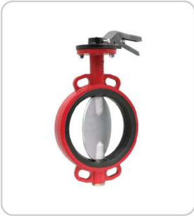
Wafer Tipi Paslanmaz Klapeli Kelebek Vanalar Wafer Type Stainless Flap Butterfly Valves