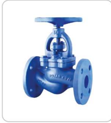
Baskılı Tip Glop Vanalar Pressed Type Globe Valves