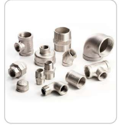
Paslanmaz Stainless Steel