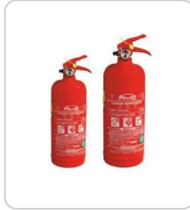
Yangın Söndürme Cihazları Fire Extinguishing Devices