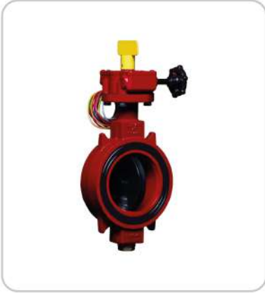
İzleme Anahtarlı Kelebek Vana Supervisory Switch Butterfly Valve