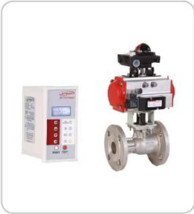
Dip Blöf Sistemi Automatic Blowdown System