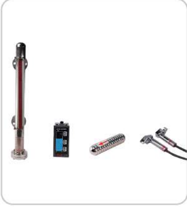
Kazan Tipi Manyetik Seviye Gösterge Cihazı Boiler Type Magnetic Level Gauge