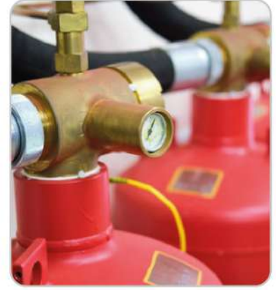
Fm200 Gazlı Söndürme Sistemleri Fm200 Fire Suppression Systems