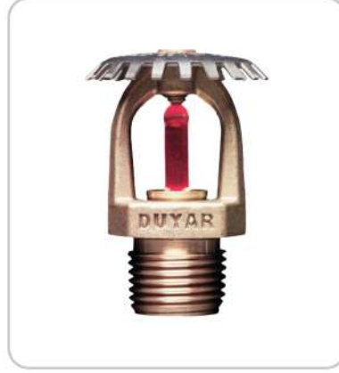
Upright Sprinkler Dik Tip Upright Sprinkler