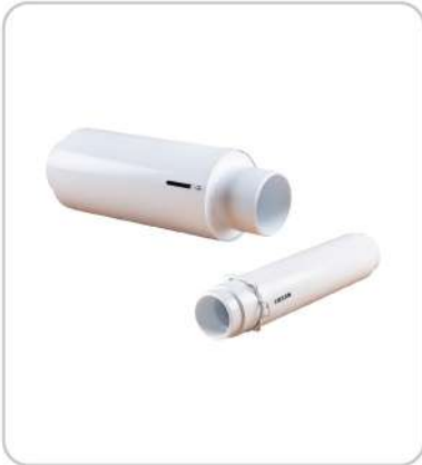
Boru Kompansatörü Pipe Expansion Joint