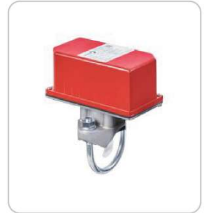
Flow Swicth (Akış Şalteri) Flow Switch