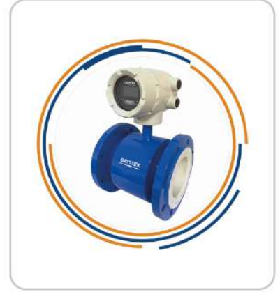
Elektromanyetik Debimetre Electromagnetic Flowmeter