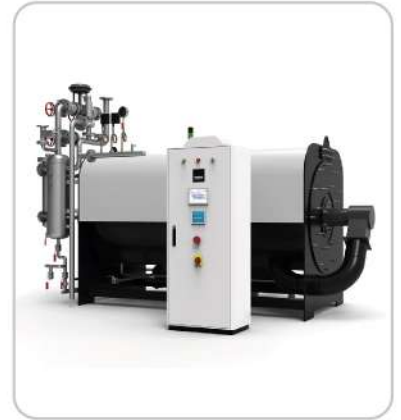
Buhar Jeneratörleri Steam Generators