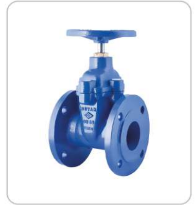
Gate Sürgülü Vanalar Gate Valves