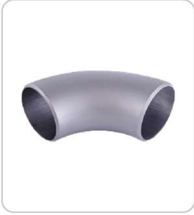
Kaynaklı (Patent) Welded (Patent)