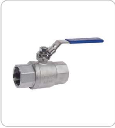
Paslanmaz Çelik Dişli Küresel Vanalar Stainless Steel Threaded Ball Valves