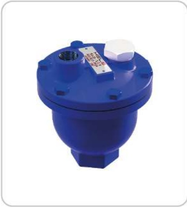
Hava Atıcı Air Vent