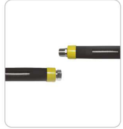
Fan-Coil Hortumları Fan-Coil Hoses