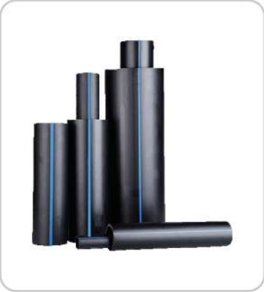
HDPE Borular HDPE Pipes