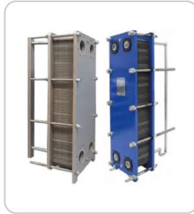
Plakalı EŐanjör Plate Heat Exchanger