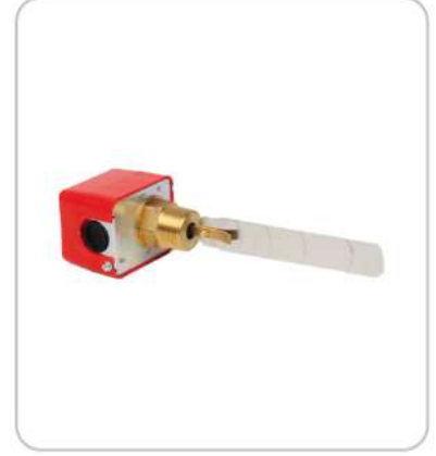
Akış Şalteri Flow Switch