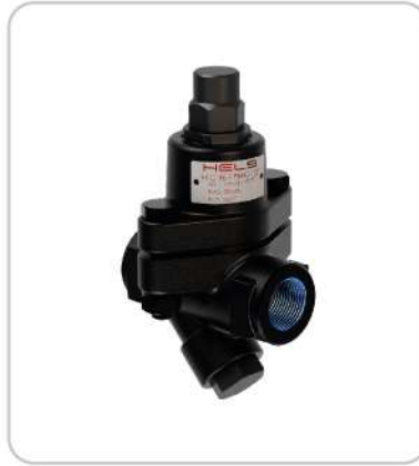
Bimetalik Bi-Metallic Steam Trap