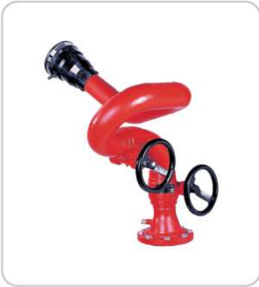
Su Köpük Monitörü Water Foam Monitor