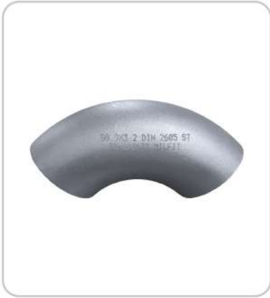
Dikişsiz (SCH20, SCH40, SCH80) Seamless (SCH20, SCH40, SCH80)