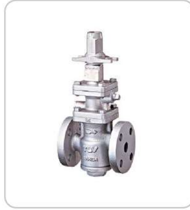
Basınç Düşürücü Vanalar Pressure Reducing Valves