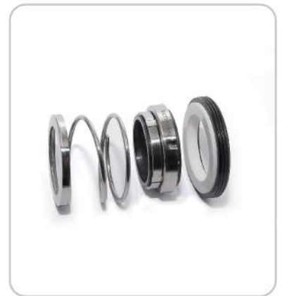
Mekanik Salmastralar Mechanical Seal