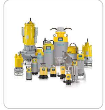
Dalgıç Pompalar Submersible Pumps