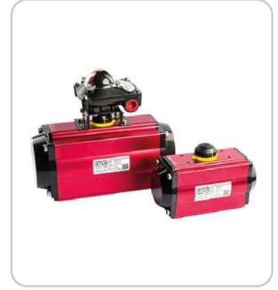
Pnömatik Aktüatörler Pneumatic Actuators