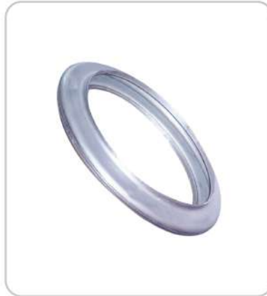
Lens Kompansatör Çeşitleri Lens Type expansion joint