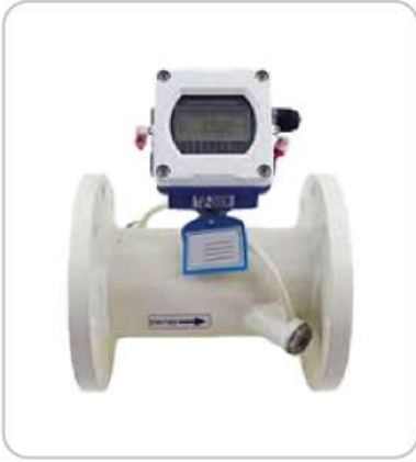
Ultrasonik Debimetreler Ultrasonic Flowmeters