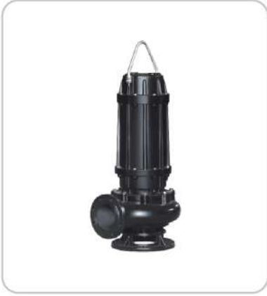
Atık Su Pompaları Sewage and Drainage Pumps