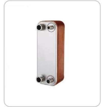
Lehimli EŐanjör Brazed Heat Exchanger