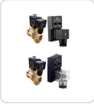
Selenoid Vanalar Solenoid Valves