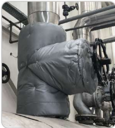
Vana Ceketı Insulation Jackets