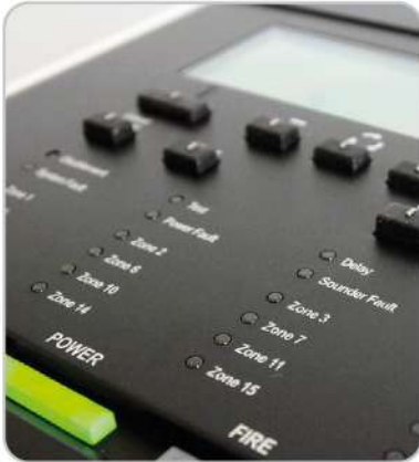
Yangın Algılama ve İhbar Sistemi Fire Detection and Notification System