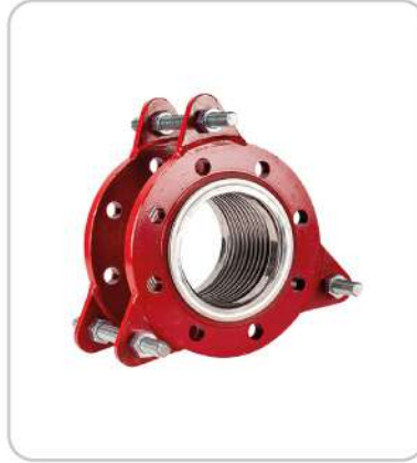
Limitrotlü Titreşim Yutucu Kompansatör Vibration Absorber