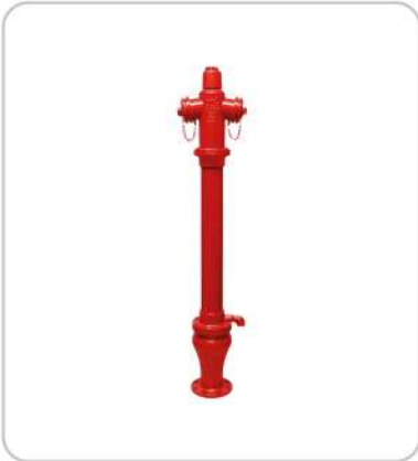
Hidrant Fire Hydrant System