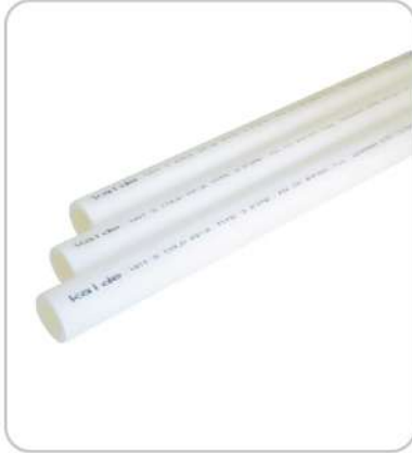
PPRC Borular PPRC Pipes