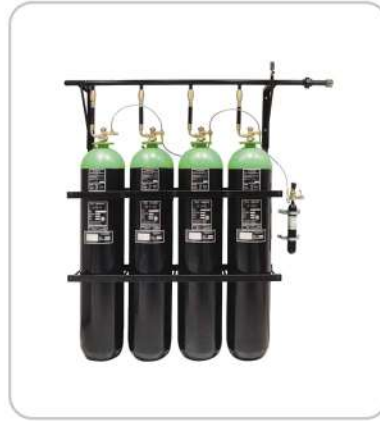
Inert Gazlı Söndürme Sistemleri Inert Gas Fire Suppression Systems