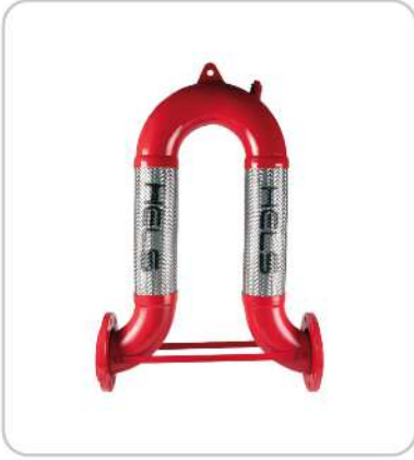
Omega U Flex Omega U-Flex