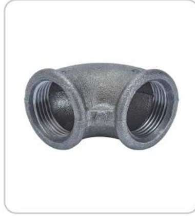
Dişli (Döküm) Threaded (Casting)