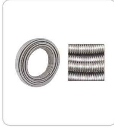
Örgüsüz Hortumlar Non-Braided Metal Hoses