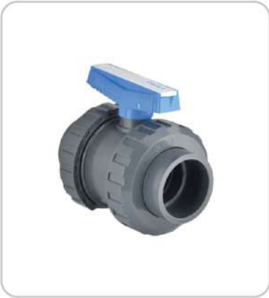
U-PVC Küresel Vanalar U-PVC Ball Valves