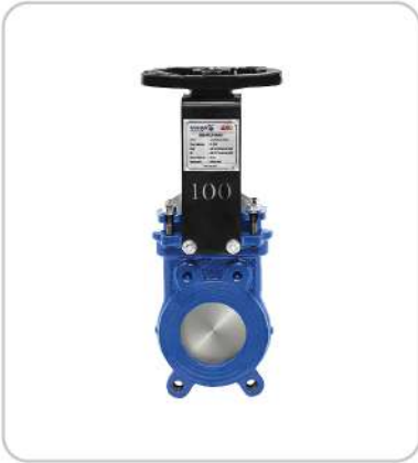
Bıçaklı Vanalar Knife Valves