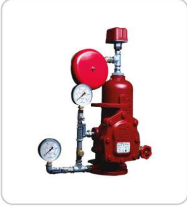
Islak Alarm Vanası Wet Alarm Valve