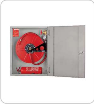
Yangın Dolapları Fire Cabinets