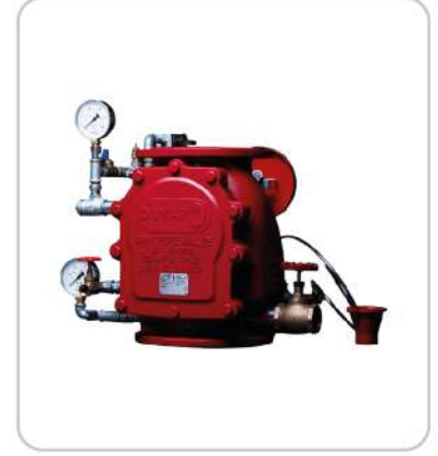
Kuru Alarm Vanası Dry Alarm Valve