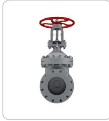
Ansi Normu Gate Vana Ansi Norm Gate Valve