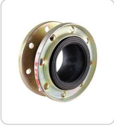
Kauçuk Kompansatör Rubber Expansion Joint