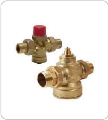
Balans Vanaları Balance Valves