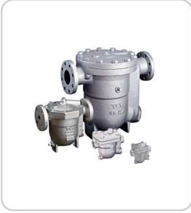
Şamandıralı Float Type Steam Trap