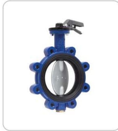
Lug Tipi Nikel Klapeli Kelebek Vanalar Lug Type Nickel Flap Butterfly Valves