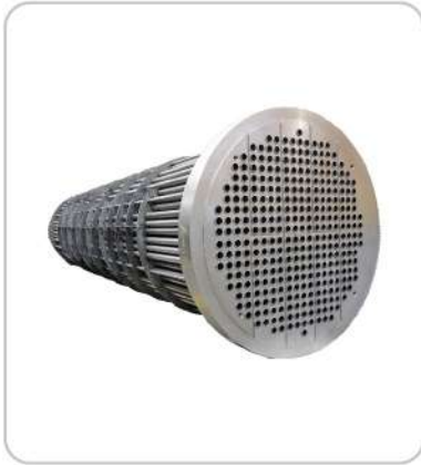
Borulu EŐanjör Shell & Tubular Heat Exchanger