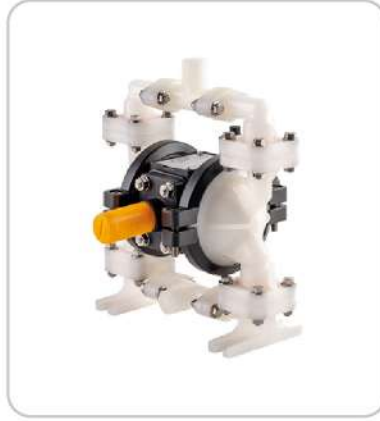
Diyafıramlı Pompalar Diaphragm Pumps