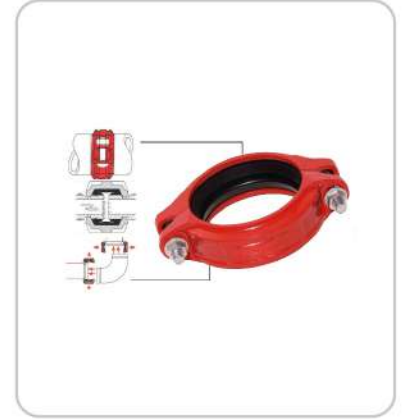
Yivli Kaplinler Grooved Couplings