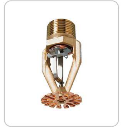
Esfr Tip Depo Sprinkleri Esfr Type Warehouse Sprinkler