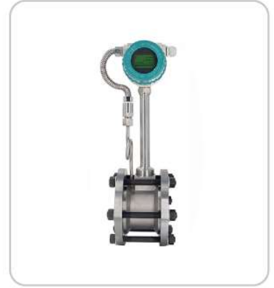
Vortex Buhar Sayacı Vortex Steam Flowmeter