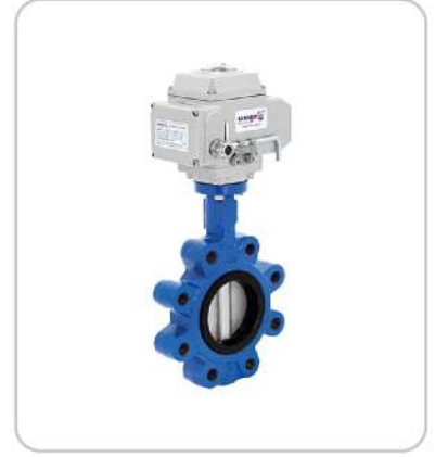
Elektrik Aktüatörlü Kelebek Vanalar Electric Actuated Butterfly Valves