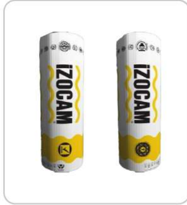
Cam Yünü Glass Wool