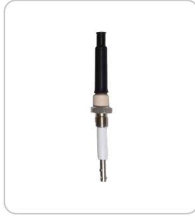
İletkenlik Tip Seviye Şalterleri Conductivity Type Level Switches