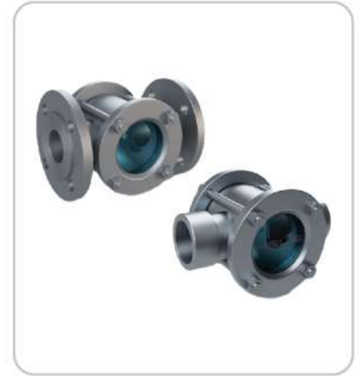
Akış Göstergesi Sight Glass