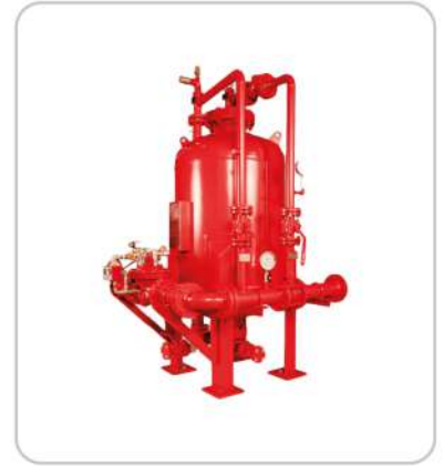
Köpüklü Söndürme Sistemleri Foam Fire Fighting Systems