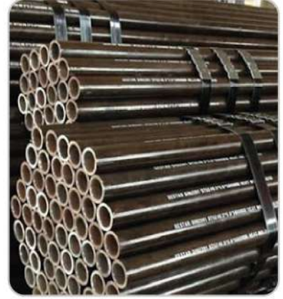
Doğalgaz Boruları Natural Gas Pipes