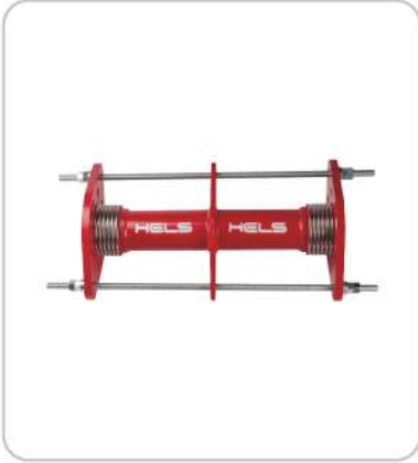
Limitrotlü Dilatasyon Kompansatörü Universal Tied Expansion Joints