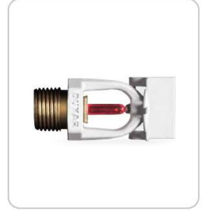
Sidewall Sprinkler Duvar Tipi Sidewall Sprinkler