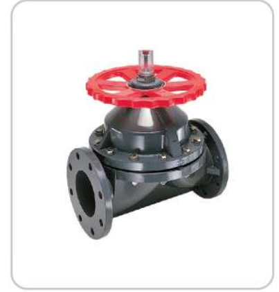
Diyaframlı Vanalar Diaphragm Valves