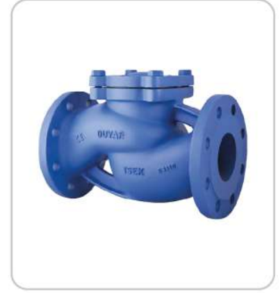
Çekvalfler Check Valves