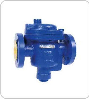
Ters Kovalı Inverted Bucket Steam Trap