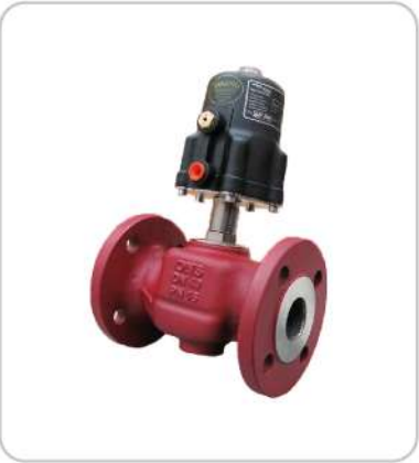
On-Off Vanalar On-Off Valves