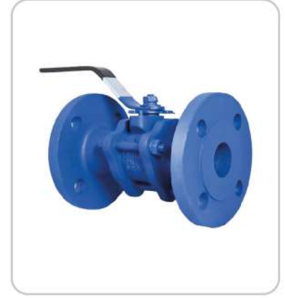
Flanşlı Küresel Vanalar 3 Parçalı Flanged Ball Valves 3 Piece