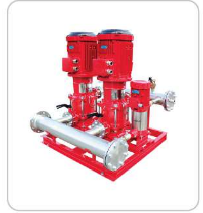
Yangın Pompaları Fire Fighting Pumps