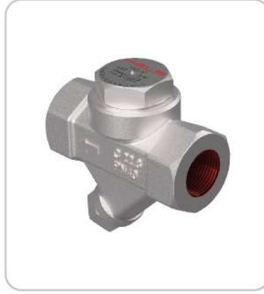
Termodinamik Thermodynamic Steam Trap