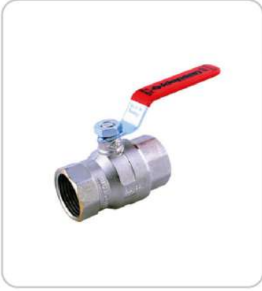
Pirinç Küresel Vanalar Brass Ball Valves