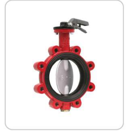
Lug Tipi Paslanmaz Klapeli Kelebek Vanalar Lug Type Stainless Flap Butterfly Valves