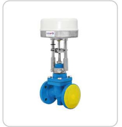
Elektrik Aktüatörlü Kontrol Vanaları Electric Actuated Control Valves