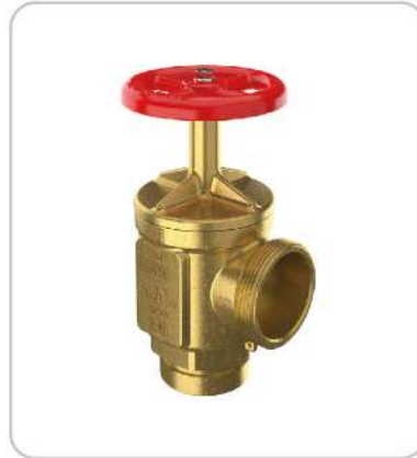
İtfaiye Bağlantı Vanası Angle Hose Valve