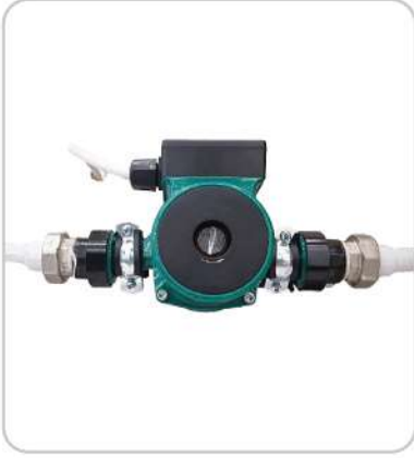
Sirkülasyon Pompaları Circulation Pumps