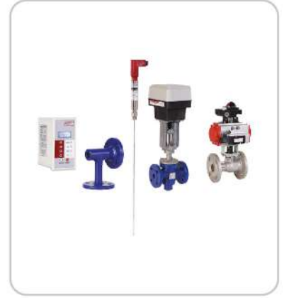
Yüzey Blöf (TDS) Kontrol Automatic Surface Blowdown (TDS) System