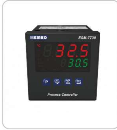
Proses Kontrolörleri Process Controllers