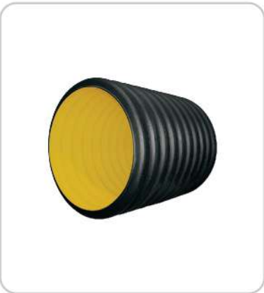
Koruge Boru Corrugated Pipe