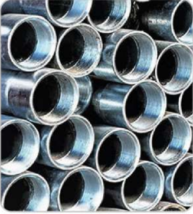
Su Boruları Water Pipes