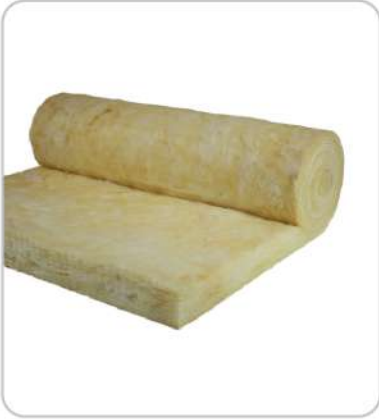
Cam Elyaf Glass Fiber