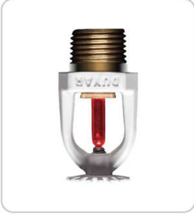
Pendent Sprinkler Sarkık Tip Pendent Sprinkler