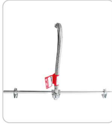
Sprinkler Bağlantı Hortumu ve Seti Sprinkler Connection Hose and Set