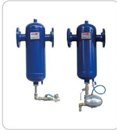
Buhar Seperatörü Steam and Air Separator