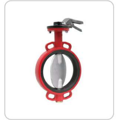
Wafer Tipi Nikel Klapeli Kelebek Vanalar Wafer Type Stainless Flap Butterfly Valves