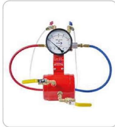
Flowmeter (Akış Ölçer) Flowmeter