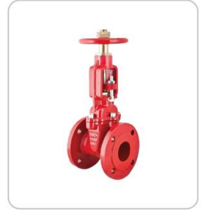
Yükselen Milli Vana OS&Y Gate Valve