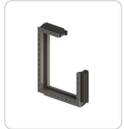
Kare Kompansatörler Square Expansion Joints