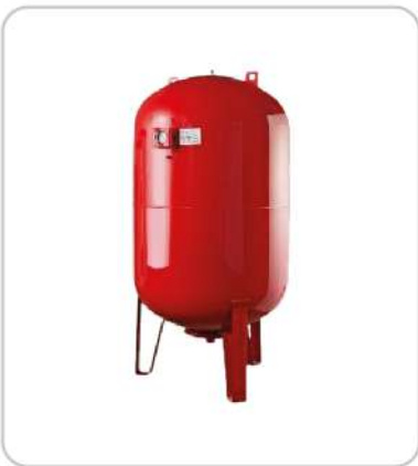
Genleşme Tankları Expansion Tanks