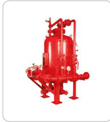
Bladder Tank Bladder Tank