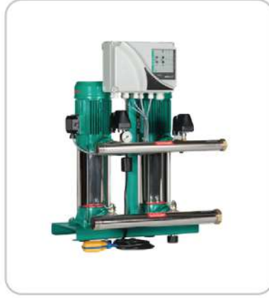
Hidrofor Seti Water Booster Systems