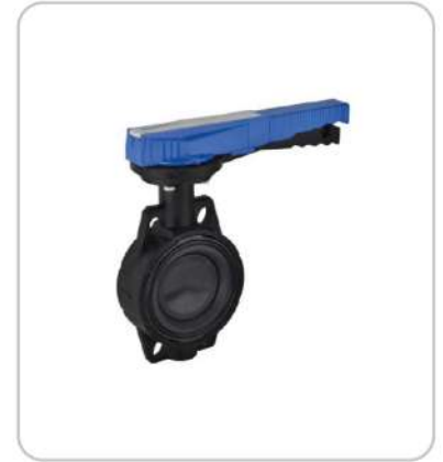
Plug Vanalar Plug Valves