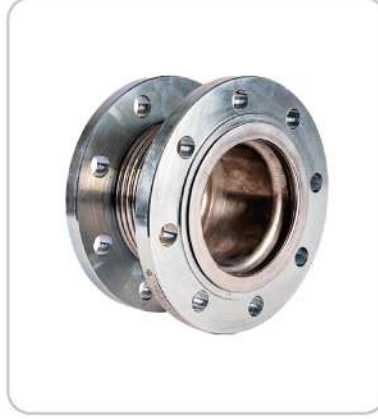
Metal Körüklü Eksenel Kompansatör Axial Expansion Joint