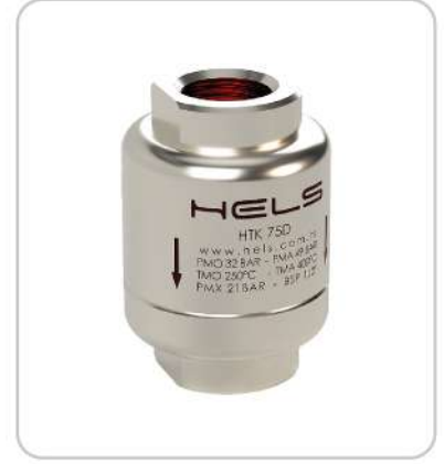
Termostatik Thermostatic Steam Trap