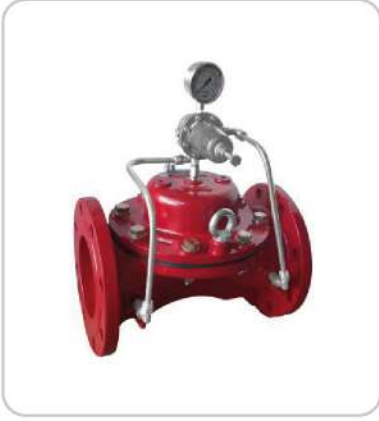
Basınç Düşürücü Vana Pressure Reducing Valve