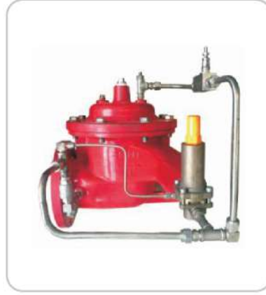
Basınç Rahatlatma (Relief) Vana Pressure Relief Valve