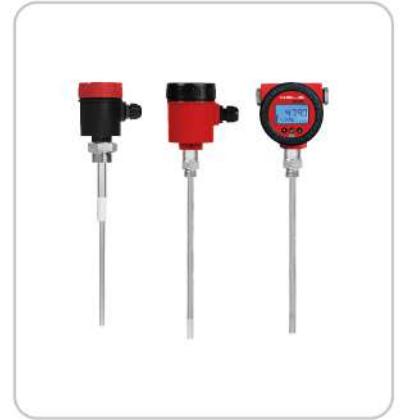
Kapasitif Seviye Şalterleri Capacitive Level Switches