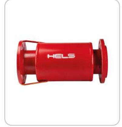
Dıştan Basıncılı Kompansatör Externally Pressurized Expansion Joint