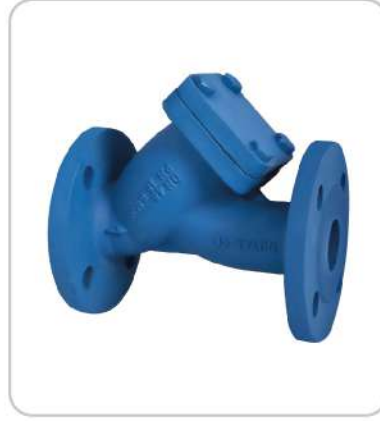
Pislik Tutucular Strainers