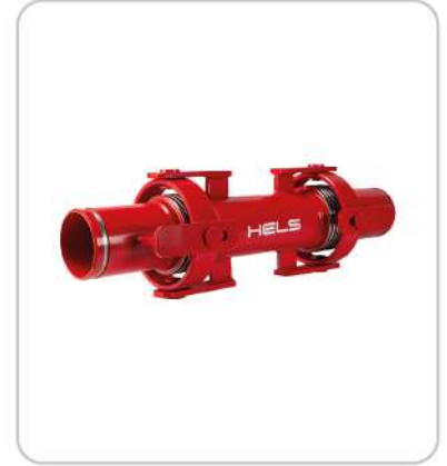
Kardan Mafsallı Dilatasyon ve Deprem Kompansatörü Double Gimbal Expansion Joints