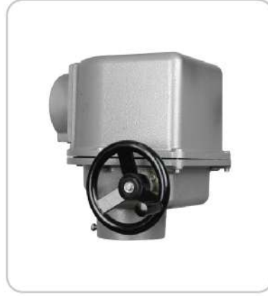
Elektrik Aktüatörler Electric Actuators