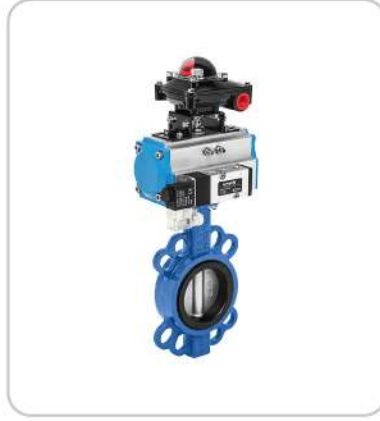
Prömatik Aktüatörlü Kelebek Vanalar Butterfly Valves with Pneumatic Actuators