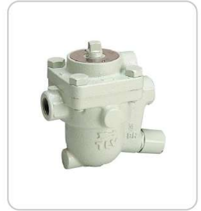
Sıvı Atıcı Air Traps