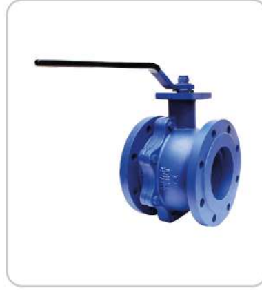
Flanşlı Küresel Vanalar 2 Parçalı Flanged Ball Valves 2 Piece