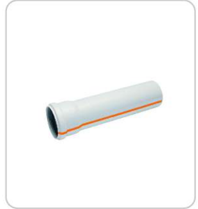
PVC Borular PVC Pipes