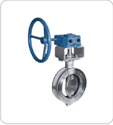
Yüksek Performans Kelebek Vanalar High Performance Butterfly Valves