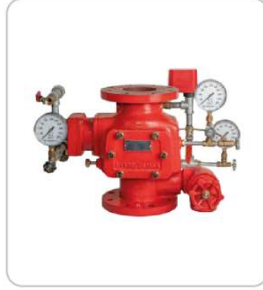
Baskın Alarm Vanası Deluge Alarm Valve