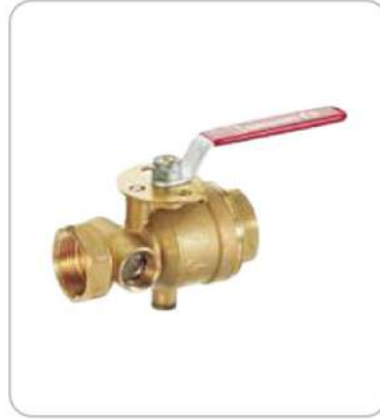
Test Drenaj Vanası Test and Drainage Valves