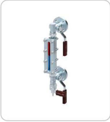
Reflex Camlı Seviye Gösterge Çeşitleri Level Gauges With Reflex Glass