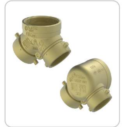
İtfaiye Bağlantı Ağzı Exposed Fire Department Inlet Connections