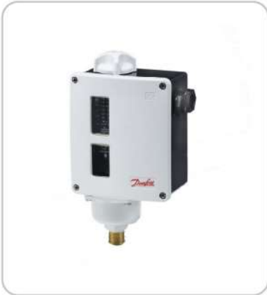
Fark Basınç Presostatı RT116 Differential Pressure switch RT116