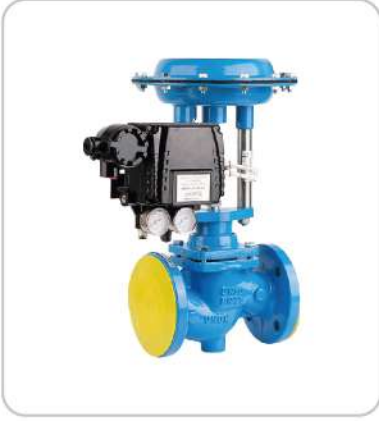
Pnömatik Aktüatörlü Kontrol Vanalar Pneumatic Actuated Control Valves