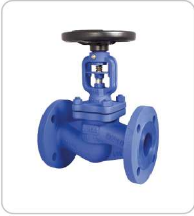
Metal Körüklü Glop Vanalar Metal Bellows Globe Valves