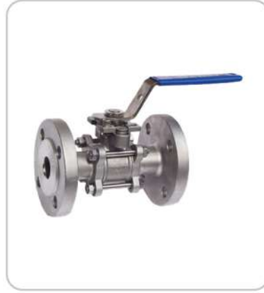
Paslanmaz Çelik Flanşlı Küresel Vanalar Stainless Steel Flanged Ball Valves