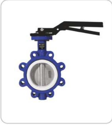
Teflon Contalı Kelebek Vanalar Butterfly Valves with Teflon Seals