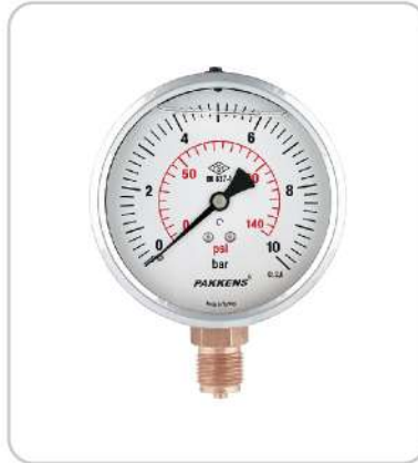
Manometre Pressure Gauge