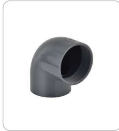
U-PVC Fittingsler U-PVC Fittings