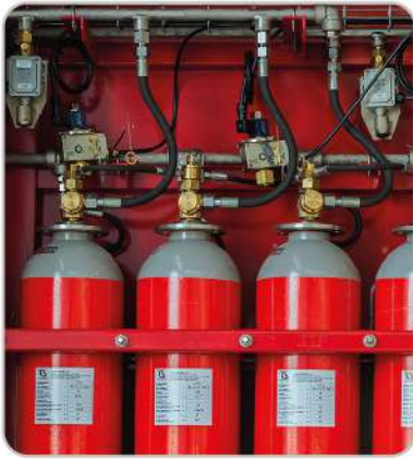
Co2 Gazlı Söndürme Sistemleri Co2 Fire Extinguishing Systems