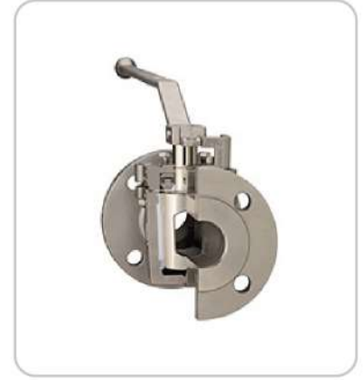
U-PVC Kelebek Vanalar U-PVC Butterfly Valves